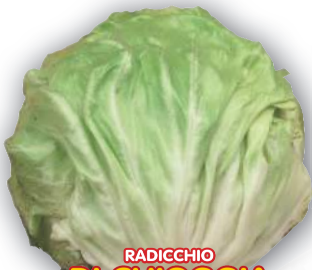
RADICCHIO DI CHIOGGIA BIANCO TARDIVO SEL. CAVARZERE

RESISTENTE ALLE BASSE TEMPERATURE! PER RACCOLTA FINO A FEBBRAIO