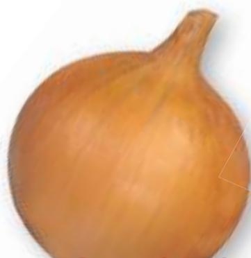
DORATA DI PARMA