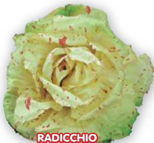
RADICCHIO DI CASTELFRANCO PRECOCE