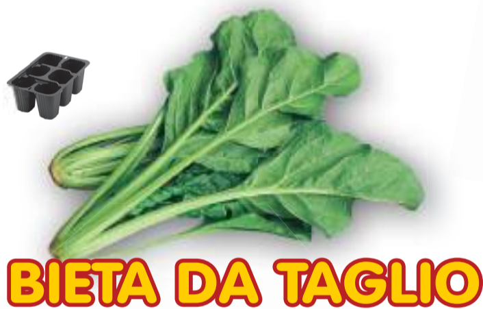
BIETA DA TAGLIO