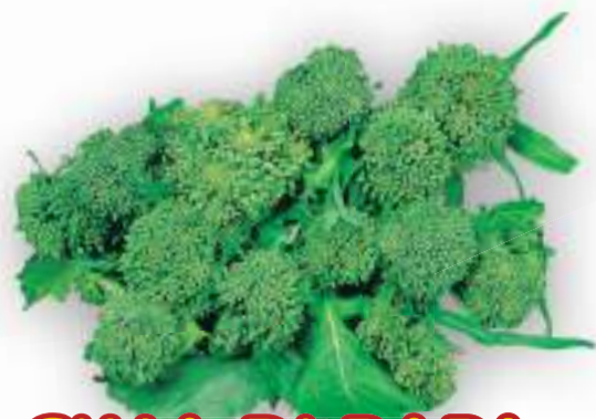
CIMA DI RAPA O FRIARIELLO RACCOLTA 90 GIORNI

GLI APICI PRIMA DELLA FIORITURA POSSONO ESSERE RACCOLTI COME FRIARIELLI