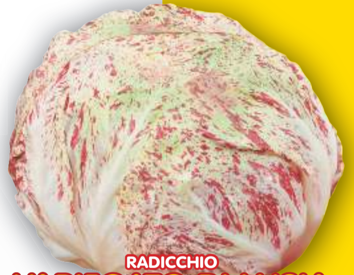
RADICCHIO VARIEGATO DI LUSIA TARDIVO