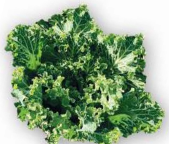
CAVOLO BROCCOLO BASTARDO RICCIO