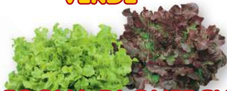
FOGLIA DI QUERCIA VERDE E ROSSA

NOTE: Disponibilità piantine da metà gennaio a novembre Per impianti precoci coprire con TNT Sesto d'impianto: 40/45 cm tra le file 30/35 cm sulla fila