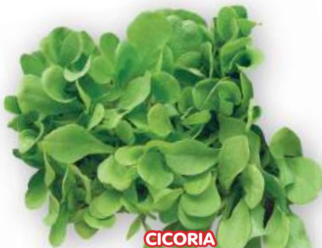
CICORIA ZUCCHERINA DI TRIESTE

PER RACCOLTA AUTUNNO INVERNALE FINO A PRIMAVERA