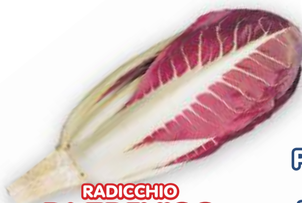
RADICCHIO DI TREVISO PRECOCE