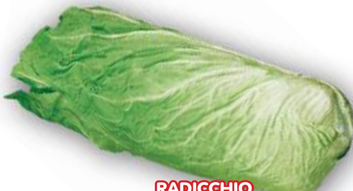
RADICCHIO PAN DI ZUCCHERO