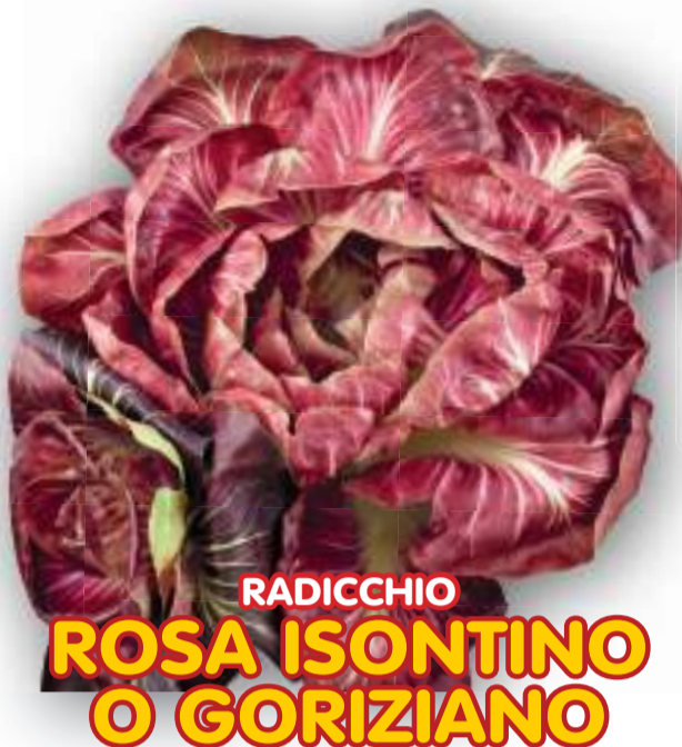
RADICCHIO ROSA ISONTINO O GORIZIANO