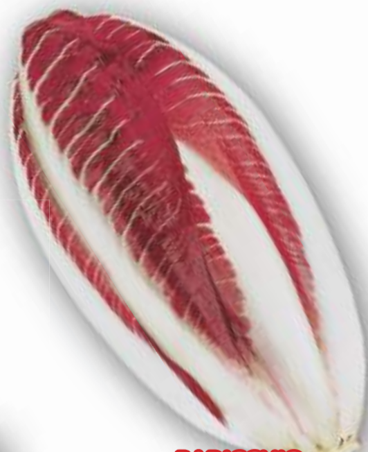
RADICCHIO DI TREVISO AUTOCHIUDENTE BARBAROSSA TARDIVO