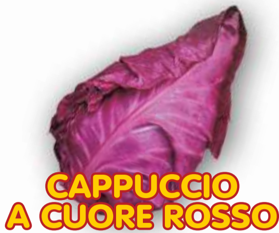
CAPPUCCIO A CUORE ROSSO

RACCOLTA 40/50 GIORNI RESISTENTE ALLE SPACCATURE