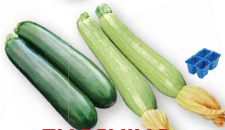
ZUCCHINO VERDE E CHIARO

PRECOCE-TARDIVA-MEDIA disponibile dal 15/08