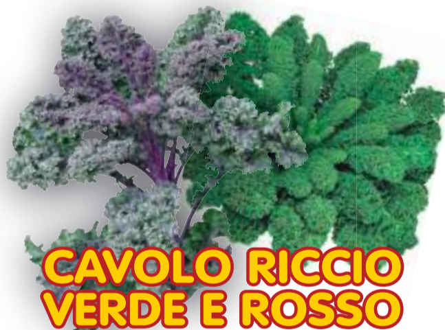
CAVOLO RICCIO VERDE E ROSSO