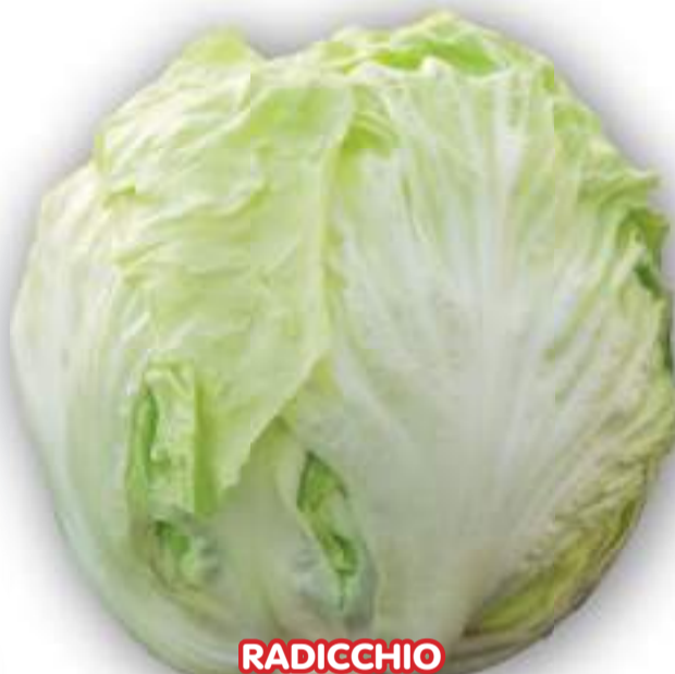
RADICCHIO BIANCO DI LUSIA TARDIVO

RESISTENTE ALLE BASSE TEMPERATURE! PER RACCOLTA FINO A FEBBRAIO