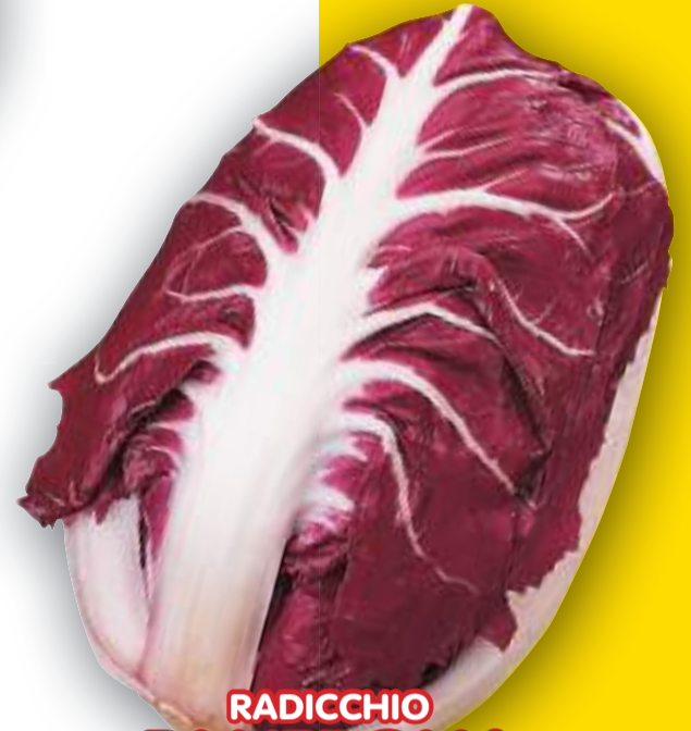
RADICCHIO DI VERONA TARDIVO