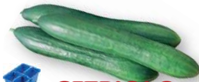
CETRIOLO LUNGO DIGERIBILE