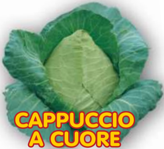
CAPPUCCIO A CUORE

RACCOLTA 40/50 GIORNI RESISTENTE ALLE SPACCATURE