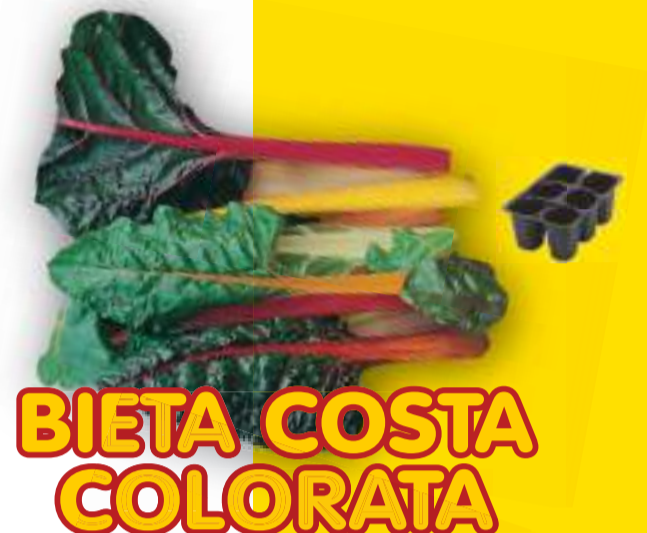
BIETA COSTA COLORATA