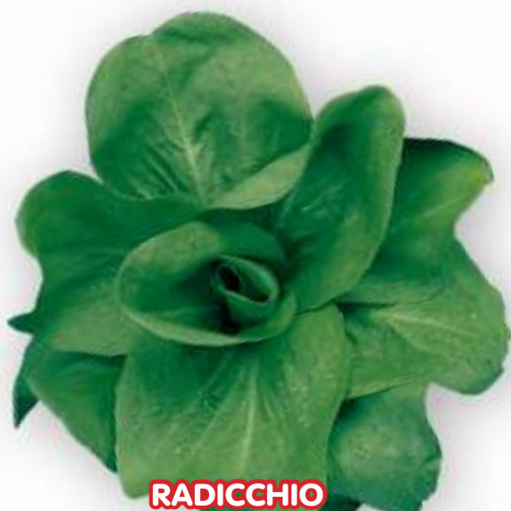
RADICCHIO A GRUMOLO DI MONSELICE

PER RACCOLTA AUTUNNO INVERNALE FINO A PRIMAVERA