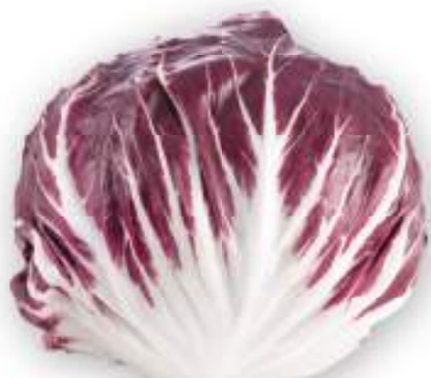
RADICCHIO DI CHIOGGIA PRECOCE