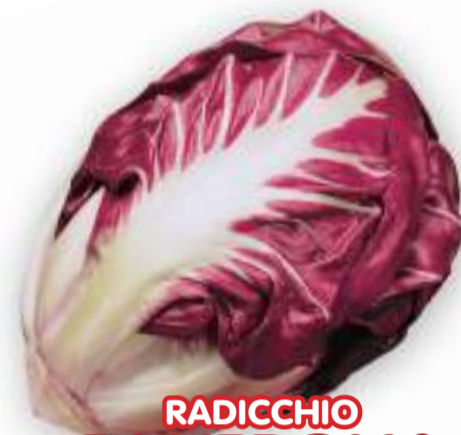
RADICCHIO DI VERONA PRECOCE