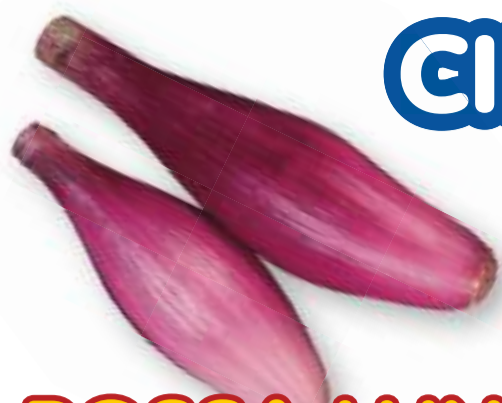
ROSSA LUNGA DI FIRENZE