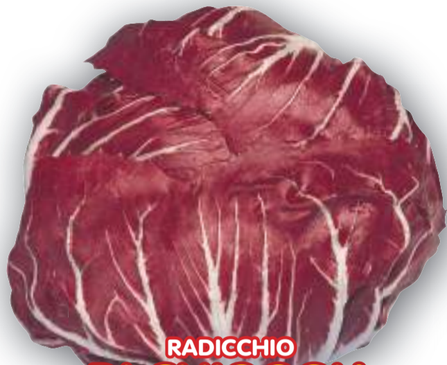
RADICCHIO DI CHIOGGIA ROSSO TARDIVO