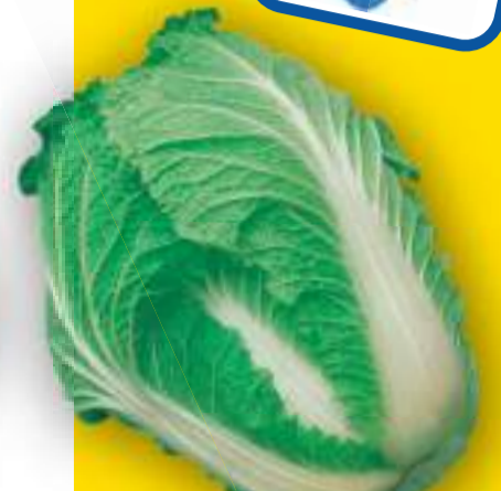
CAVOLO CINESE RACCOLTA 50/60 GIORNI