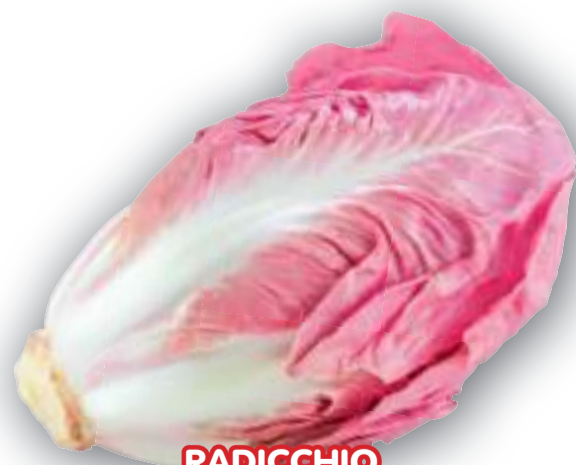
RADICCHIO ROSA DI VERONA TARDIVO