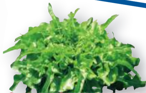
BARBA DEI FRATI