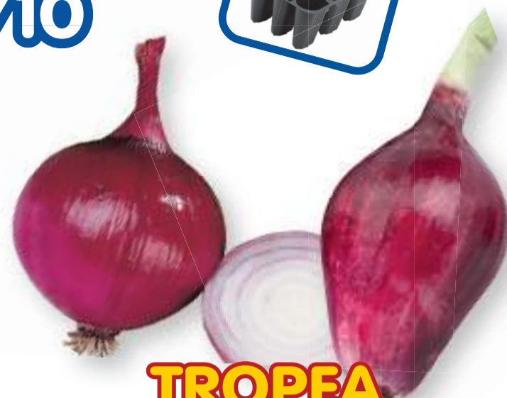
TROPEA TONDA E LUNGA