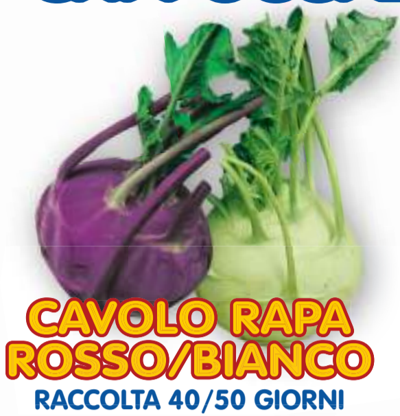
CAVOLO RAPA ROSSO/BIANCO RACCOLTA 40/50 GIORNI