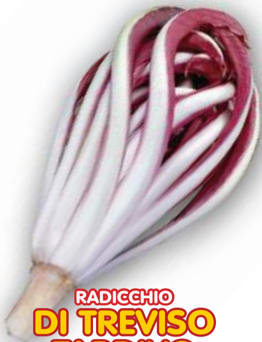
RADICCHIO DI TREVISO TARDIVO