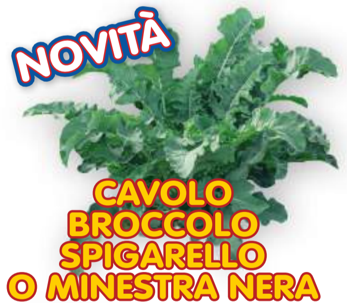
CAVOLO BROCCOLO SPIGARELLO O MINESTRA NERA