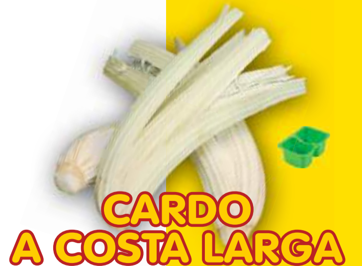
CARDO A COSTA LARGA

VARIETÀ PROFESSIONALE CAPRICCIO F1 MOLTO PRODUTTIVO