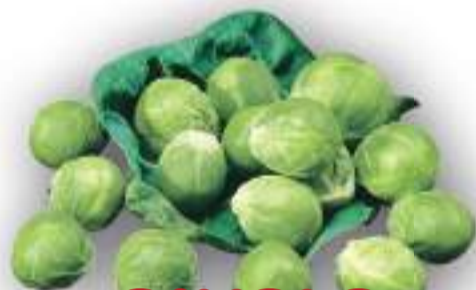
CAVOLO DI BRUXELLES RACCOLTA 80/90 GIORNI