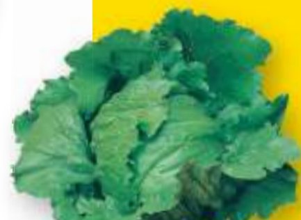
REGINA DEI GHIACCI