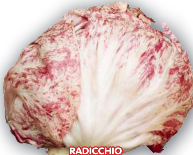
RADICCHIO DI CHIOGGIA VARIEGATO SEL. ADRIA