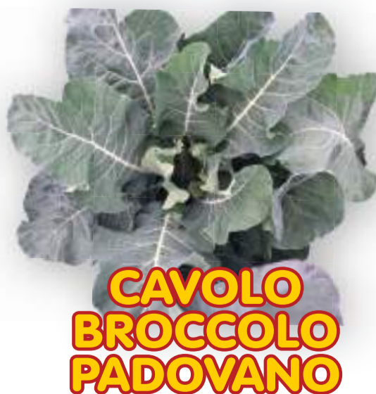
CAVOLO BROCCOLO PADOVANO