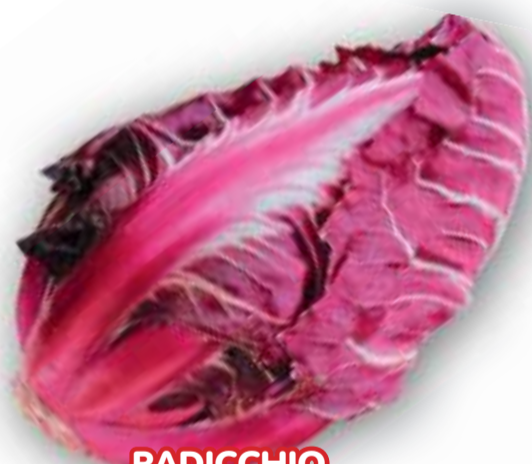
RADICCHIO DI VERONA A COSTA ROSSA TARDIVO

PARTICOLARE LA COLORAZIONE ROSSA DELLA COSTA! PER RACCOLTA DA NOVEMBRE A FEBBRAIO