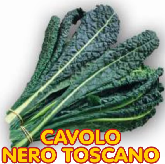
CAVOLO NERO TOSCANO