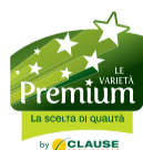
FINOCCHIO PALLADIO F1 GROSSA PEZZATURA, AROMATICO, VELOCE TRAPIANTO DA AGOSTO A SETTEMBRE