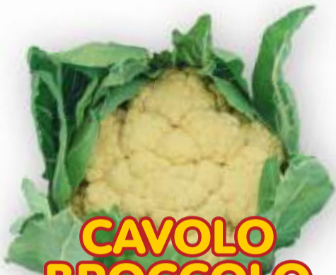
CAVOLO BROCCOLO BASSANESE RACCOLTA 90/140 GIORNI