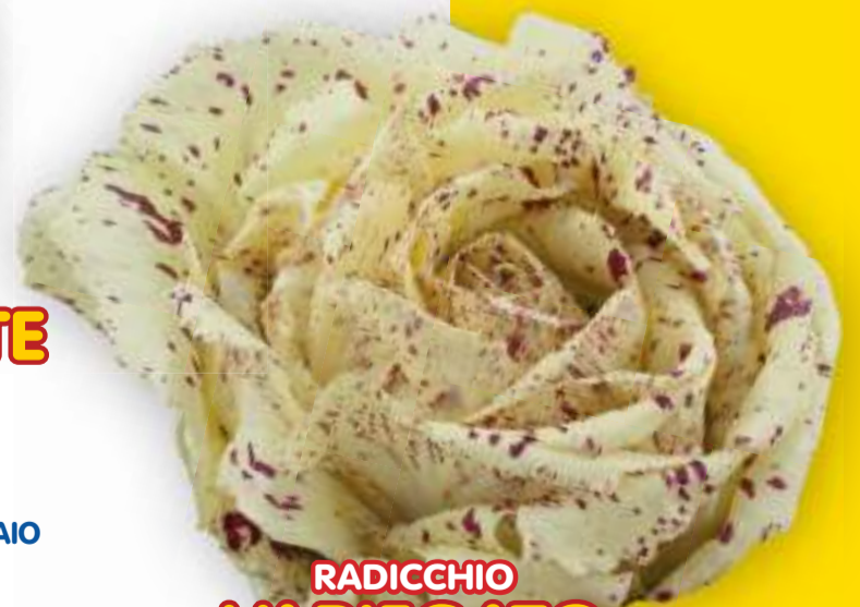
RADICCHIO VARIEGATO DI CASTELFRANCO SEL. MASERÀ