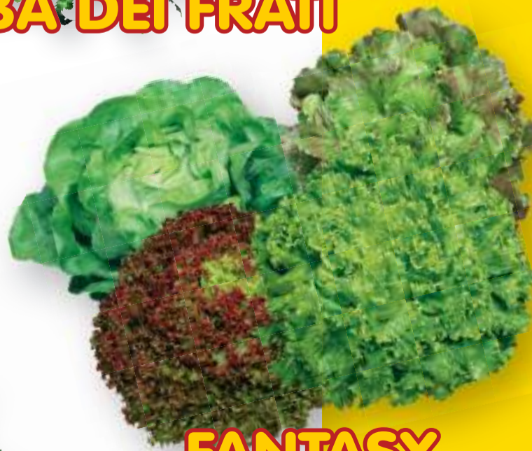
FANTASY MIX DI LATTUGHE DA CESPO