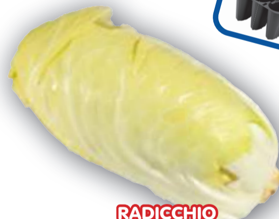
RADICCHIO GIALLO DI VERONA VERDORO

NOTE: Sesto d'impianto: 40/45 cm tra le file 30/35 cm sulla fila TRAPIANTO AGOSTO-SETTEMBRE PER LE VARIETÀ PIÙ VIGOROSE, CASTELFRANCO ADRIA E CAVARZERE CONSIGLIAMO DI AUMENTARE LA LARGHEZZA TRA LE PIANTE A 35/40 CM NEI PRIMI GIORNI DOPO IL TRAPIANTO IRRIGARE FREQUENTEMENTE PER FACILITARE L'ATTECCIMENTO CONCIMARE ADEGUATAMENTE