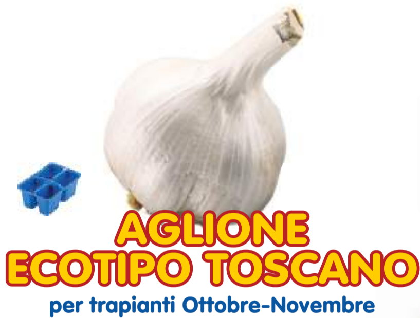
AGLIONE ECOTIPO TOSCANO