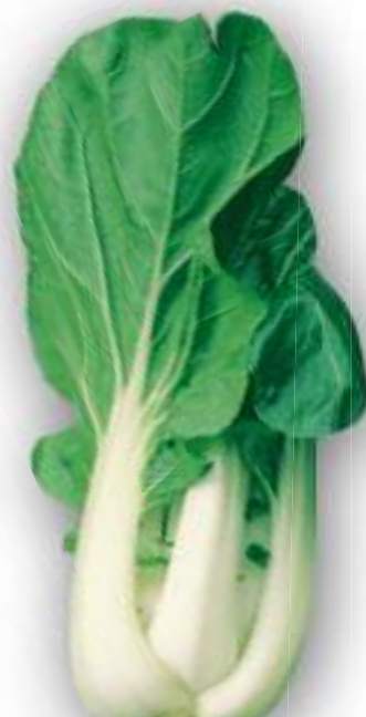
CAVOLO PACKCHOI RACCOLTA 35/40 GIORNI

GLI APICI PRIMA DELLA FIORITURA POSSONO ESSERE RACCOLTI COME FRIARIELLI