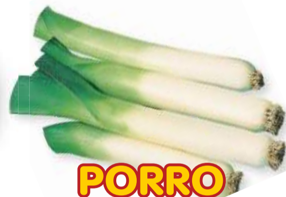
PORRO AUTORA FI VIGORA FI