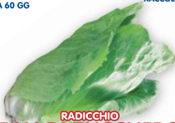
RADICCHIO PAN DI ZUCCHERO