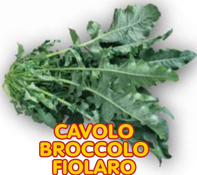
CAVOLO BROCCOLO FIOLARO