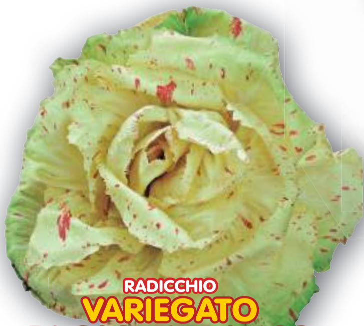
RADICCHIO VARIEGATO DI CASTELFRANCO TARDIVO