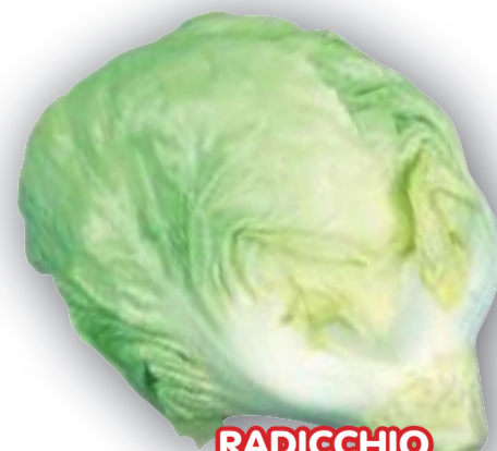
RADICCHIO BIANCO MANTOVANO TARDIVO