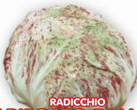
RADICCHIO VARIEGATO DI LUSIA PRECOCE

RADICCHI PRECOCI PER TRAPIANTI DA GIUGNO A SETTEMBRE